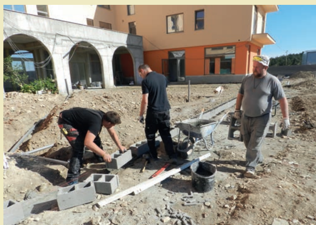
Díla se mimo sebranických chopila i komunita. Stále je tu práce (jak) na kostele.