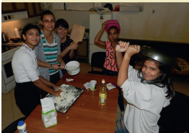
Děvčata samozřejmě ví, co patří do pánve.

(dokončení) Školní rok začal za lavicemi. Nikdo, kromě studentů, nemusel zůstat doma. I my jsme rozjeli obvyklou činnost. Kromě klasického doučování se podařilo nabídnout mladým některé nové